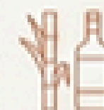
Alambique de Cachaça Pai Vovô