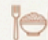
Culinária Sertaneja - Delícias do Sertão